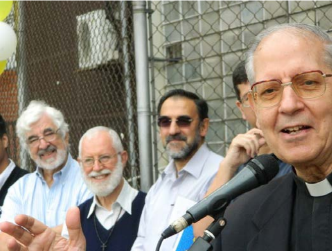
Adolfo Nicolás j. durante su visita al Jesús Obrero de Catia, 2 de mayo 2014