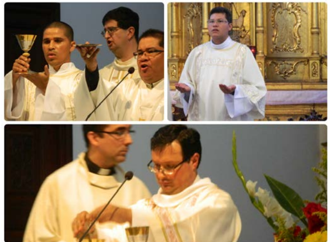
Galería fotográfica, aquí .

Nació el 9 de noviembre de 1981 en Mérida. A los 14 años ingresa en el Seminario Menor de Mérida y después de estudiar allí filosofía ingresa en el noviciado de la Compañía de Jesús el 29 de septiembre de 2002. Estudia Letras en la UCAB entre el 2004 y el 2009 y hace el magisterio en el Colegio San Ignacio hasta el 2011. Concluye la teología en la Pontificia Universidad Javeriana de Bogotá. Ha trabajado en pastoral en parroquias y comunidades cristianas como Petare, Catuche y La Vega, y en Bogotá acompañó a un grupo de Huellas y a una comunidad parroquial. En el primer semestre del 2015 trabajará en la parroquia de El Nula en el alto Apure.