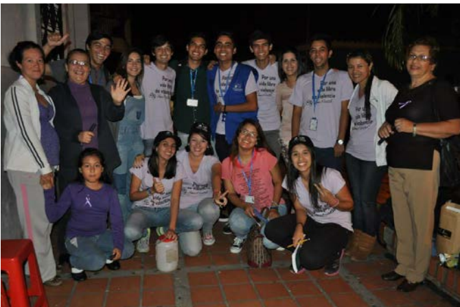
Voluntarias (os) y acompañantes en la primera vigilia por una vida libre de violencia, San Cristóbal, estado Táchira

El pasado martes 25 de noviembre en el boulevard de la Universidad Católica del Táchira (UCAT) en horas de la noche se realizó la primera vigilia por una vida libre de violencia, como parte de las actividades pautadas del Servicio Jesuita a Refugiados SJR Venezuela, por la conmemoración del Día Internacional de la Eliminación de la Violencia contra las Mujeres celebrado durante el mes de noviembre y la campaña Toma Partido por una vida libre de violencia .